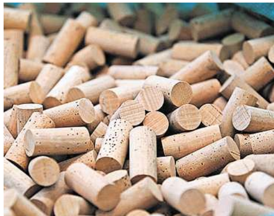
1014 Flaschen Veltliner Rotwein sollen für den Weltrekordversuch im Puschlav entkorkt werden. (KY)

POSCHIAVO Schon damals pflegte Dichterstürst Giachen Caspar Mouth (1844–1906) zu sagen: «Graubünden hat das Veltlin verloren, doch es muss zurückerobert werden, halbliterweise. Ich habe schon einmal damit begonnen.» Vielleicht hat sich das Puschlav durch diesen Satz für seinen Weltrekordversuch inspirieren lassen: Die Bevölkerung möchte nämlich am Samstag, 4. Juli, 1014 Flaschen Veltliner Rotwein innert 30 Sekunden entkorken, um in das «Guinness-Buch der Rekorde»